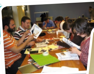
... du travail...