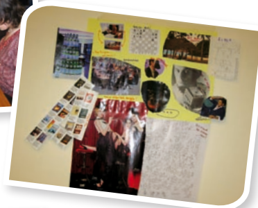
... et un peu de folie.