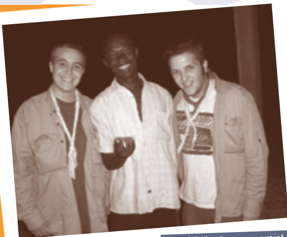
J&S Verviers a un projet de coopération avec de jeunes Sénégalais. Petits instantanés de leur voyage.